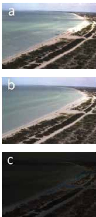
Figura 2. Ejemplo de los tipos de imágenes obtenidas para la estación de video de Sisal (Yucatán): a) imagen instantánea, b) imagen promediada y c) imagen de varianza.

Estas imágenes oblicuas son rectificadas y corregidas geométricamente para permitir la obtención de medidas cuantitativas de la playa. La figura 3 muestra un ejemplo de cinco imágenes oblicuas de la estación de Barcelona, España, y el resultado final (similar a una fotografía aérea) una vez corregidas y rectificadas geométricamente. La característica principal de la imagen presentada en la figura 3b es que todos los píxeles tienen las mismas dimensiones, lo que posibilita hacer medidas en la imagen.