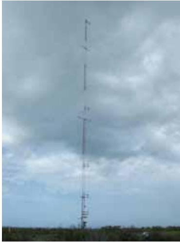
Figura 5. Torre meteorológica de la playa de Sisal donde se instalará el sistema de video

El primer paso en el posprocesado de las imágenes es la georreferenciación, que permite hacer medidas reales a partir de las fotografías. En el caso de Sisal, debido a la movilidad de la torre, se está desarrollando un software específico para lograr una georreferenciación automatizada de las imágenes. A partir de las fotografías georreferenciadas se obtendrá la ubicación de las barras de arena reflejada en las imágenes por la rotura del oleaje que generan o, en el caso de condiciones de calma, a simple vista.