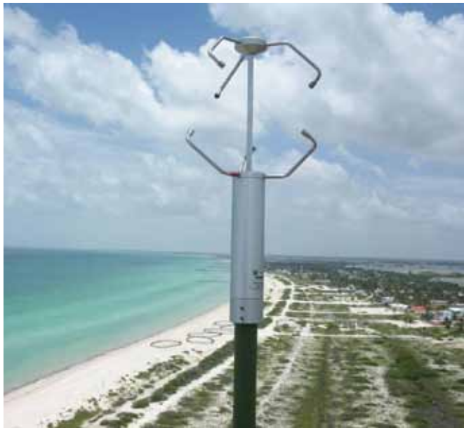
Figura 4. Playa de Sisal en condiciones de calma en donde las flechas denotan la existencia de barras

El uso de videomonitorización permitirá continuar con la obtención de datos tras la finalización del presente proyecto y, por tanto, extender los resultados a lo largo de los años para poder investigar de esta forma el ciclo de vida natural de las barras de Sisal. Este proyecto plantea un estudio de la dinámica del sistema de barras de arena sumergidas en la playa de Sisal, Yucatán, a escalas temporales de horas a meses.