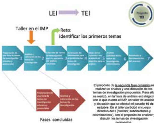
Figura 1. Etapas del proyecto TEI

Las dos primeras fases del proyecto han concluido. La primera consistió en una convocatoria emitida por la dirección del II y dirigida a todos los académicos y posdoctorantes de la comunidad del Instituto para que propusieran los temas de investigación que se consideraran relevantes para el quehacer del Instituto de Ingeniería, con la mira puesta en el año 2020. Las propuestas podían incluir temas de investigación que ya se cultivaban en el Instituto y que debían mantenerse, así como aquellos que no se desarrollan aún, pero que pudieran resultar pertinentes por su potencial.