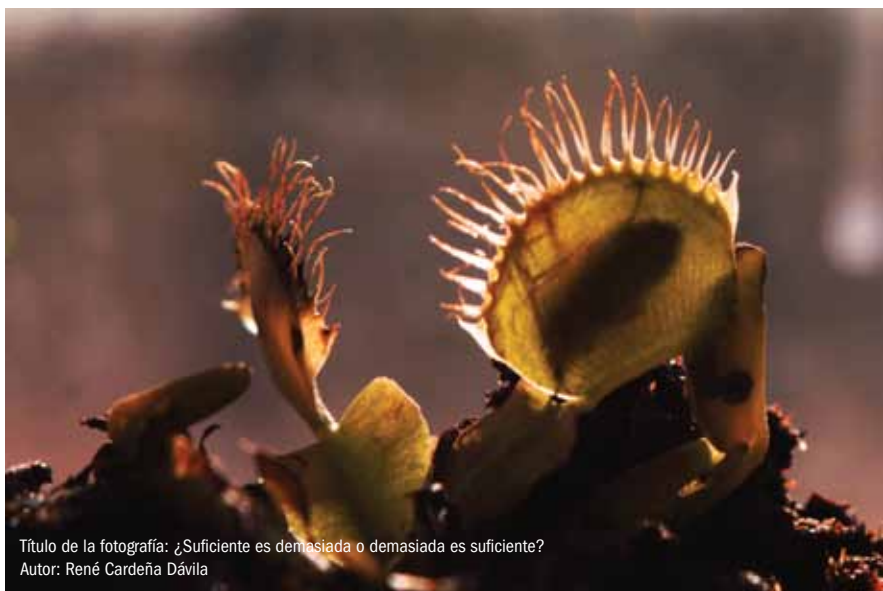
Título de la fotografía: ¿Suficiente es demasiada o demasiada es suficiente? Autor: René Cardaña Dávila