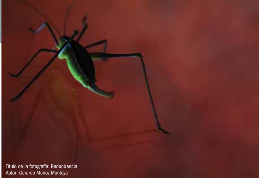
Título de la fotografía: Redundancia