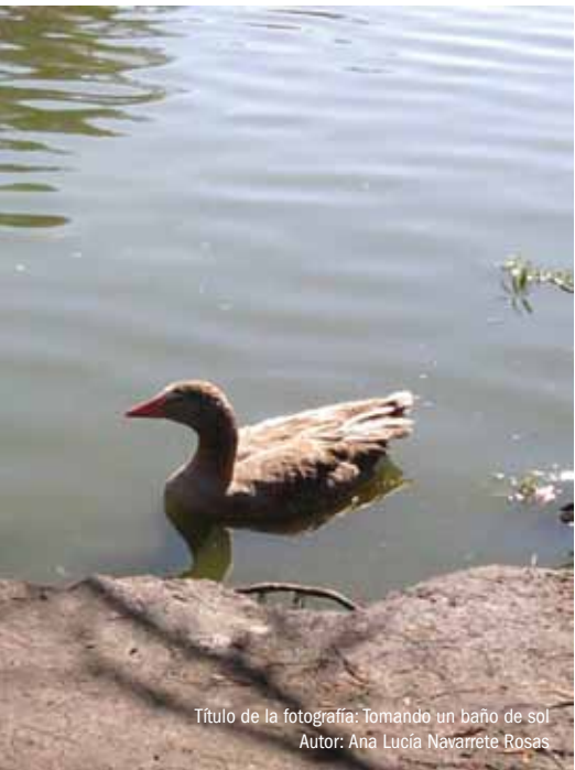
Título de la fotografía: Tomando un baño de sol