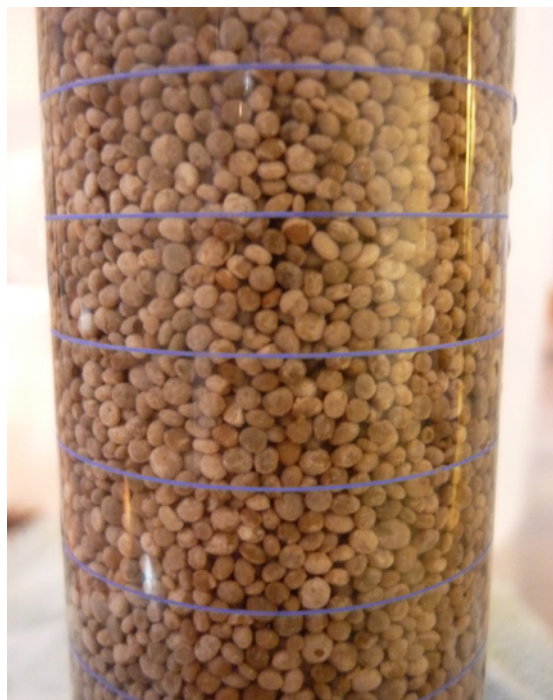
Figura 3. Gránulos bacterianos desarrollados para producir hidrógeno a partir de aguas residuales

Desde hace varios años se ha trabajado con la aplicación de la tecnología de microalgas. 8-9 El uso de microalgas se ha asociado a la producción de biodiesel. Sin embargo, es posible generar otros productos de valor agregado a partir de esta biomasa, lo que ha facilitado el desarrollo de una plataforma de biorrefinería basada en estos microorganismos. La utilización de las microalgas para el tratamiento de aguas residuales fue planteada hace ya más de cinco décadas en la Universidad de California, sobre todo como un pulimento del agua tratada para remover nutrientes como nitrógeno y fósforo. En aquéllos primeros sistemas, conocidos como lagunas de oxidación, las microalgas crecen en la superficie de agua mientras que las bacterias anaerobias (que no necesitan oxígeno) se reproducen en el fondo de la laguna. Este tipo de lagunas se sigue usando en Latinoamérica ampliamente. En México las lagunas de oxidación ocupan el segundo lugar como tecnología de tratamiento de aguas, después de los lodos activados.