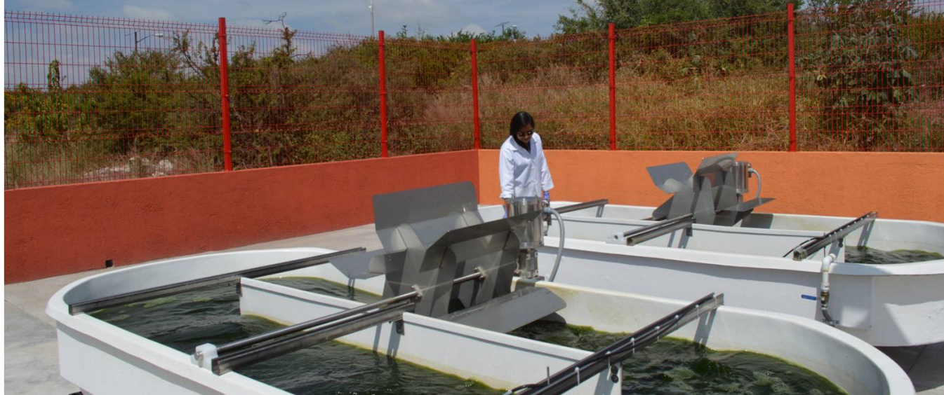
Figura 1. Reactores piloto de alta tasa (1m 3 ) operados con el sistema microalga-bacteria instalados en el exterior de la UAJ