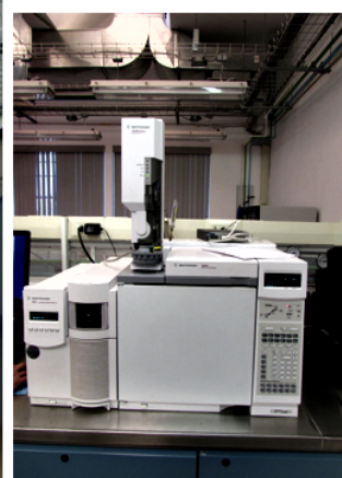
Figura 2. Equipos de cromatografía de gases para el análisis de los contaminantes en fase gaseosa