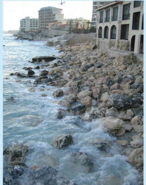
Ejemplos de playas antes y después de la erosión.

La realización de este proyecto ha incluido: 1) análisis de la información histórica existente; 2) integración de la información de campo con mediciones in situ ; 3) caracterización morfodinámica del proceso evolutivo de las costas de Quintana Roo; 4) desarrollo, adaptación y validación de modelos numéricos; 5) modelación tanto numérica como experimental en laboratorio de diversos escenarios; 6) determinación de la posible o posibles soluciones, considerando su impacto económico, medioambiental y social, y 7) discusión, en diferentes foros, de las posibles soluciones.