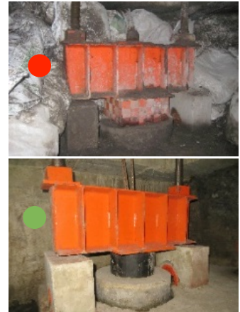
Figura 2. Ubicación de los pilotes de control