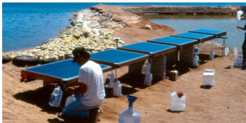
Figura 2. Varios modelos de destiladores solares de laboratorio para fines experimentales

Adicionalmente a la atención que se presta a la producción de agua potable con energía solar, hemos encontrado que muchos estudiantes de ingeniería y de ciencias físicas se interesan por esta tecnología. Ciertamente, está en crecimiento la atención que prestan los jóvenes a los temas de energía en general, y a las energías limpias en particular, y a la mejor administración de recursos naturales escasos como el agua. El estudio de los destiladores solares de agua fomenta el pensamiento multidisciplinario y el trabajo en equipo, que incluye la importante participación de los grupos de personas que participan en la construcción y operación de estos aparatos. Al mismo tiempo, es una espléndida oportunidad para apreciar la naturaleza de los fenómenos que ocurren con fuertes variaciones en el tiempo, tanto en la escala de unas horas como en meses. Los estudiantes aprenden de primera mano la importancia del clima, las características de la naturaleza que más nos afectan, y de cómo cuidarla y aprovecharla mejor. |