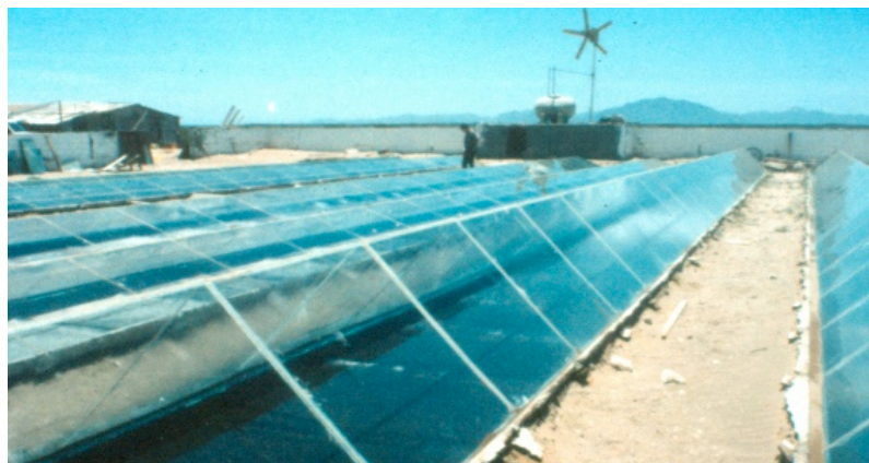
Figura 3. Destilador solar de gran dimensión para abasto de una comunidad rural (en Puerto Chale, Baja California Sur)