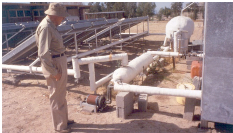
Figura 4. Destilador solar con calentamiento indirecto y recuperación de calor en etapas múltiples