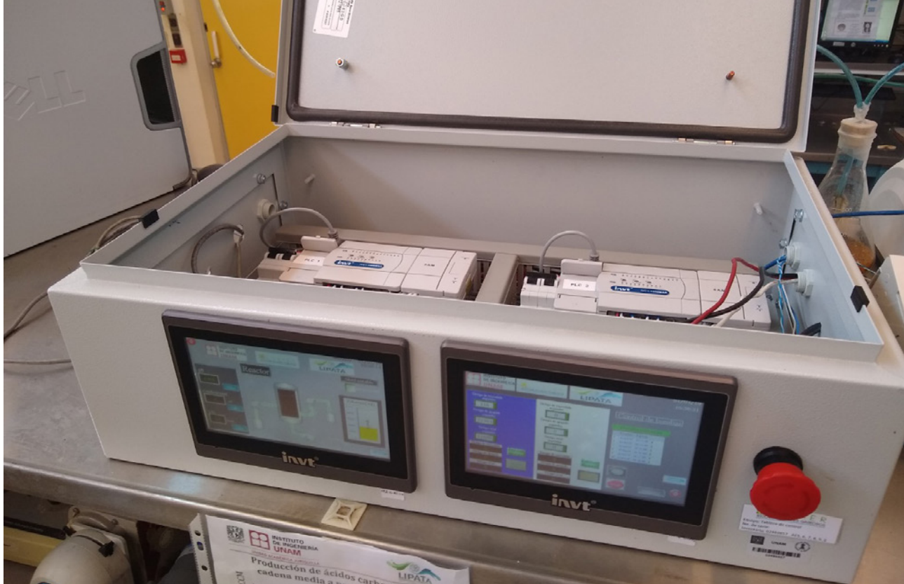
Figura 2. Sistema de adquisición de datos y control de proceso mediante PLC

que eso. Por un lado, las variables que pueden medirse son escasas; por ejemplo, no existen sensores en línea para medir varios metabolitos importantes y mucho menos para determinar concentraciones de los distintos tipos de microorganismos que intervienen. Por otro lado, es un sistema biológico y, si bien existen modelos matemáticos aproximados, todavía hay mucho desconocimiento de los procesos involucrados, lo cual provoca que existan muchas incertidumbres en sus modelos. Aunado a esto, tampoco se cuenta con diversidad de variables que el controlador pueda manipular a discreción; en el caso del biorreactor productor de biogás, una de las pocas es la velocidad de alimentación o la tasa de dilución. Finalmente, existe gran cantidad de perturbaciones a las que puede estar sujeto el sistema, desde cambios en las concentraciones en los flujos de entrada hasta las condiciones ambientales externas.