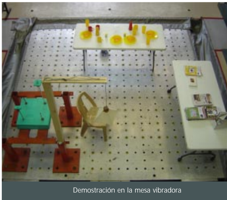
Demostración en la mesa vibradora