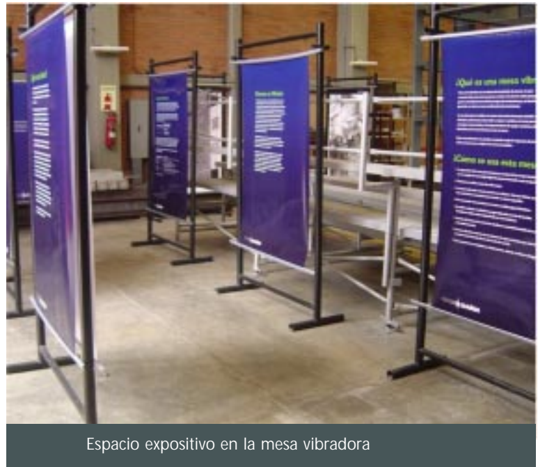
Espacio expositivo en la mesa vibradora

los daños más severos: cómo eran antes, cómo quedaron después de los terremotos y qué hay ahora. Se identificaron en un mapa las zonas más vulnerables a los efectos sísmicos en la ciudad de México. Su propósito fue exponer los proyectos de edificación en los lugares devastados; hacer recordar qué fue lo que pasó a través de distintos testimonios, y por último, enseñar cómo se produce un sismo, qué son las placas tectónicas, qué es la resonancia y qué tienen que ver con la caída de los edificios, así como cuáles son las funciones del Servicio Sismológico Nacional y cómo han ido evolucionando los sistemas de prevención de desastres.