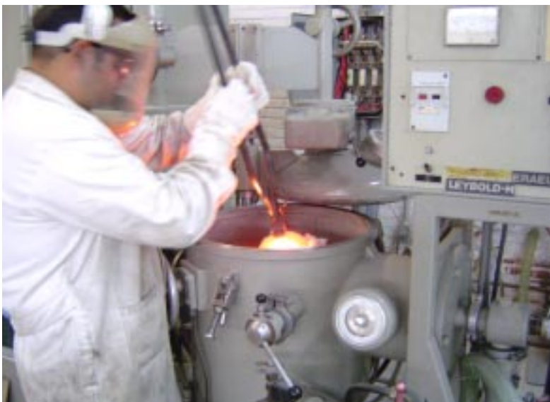
Retiro del crisol de la matriz del horno de inducción del IIM-UNAM