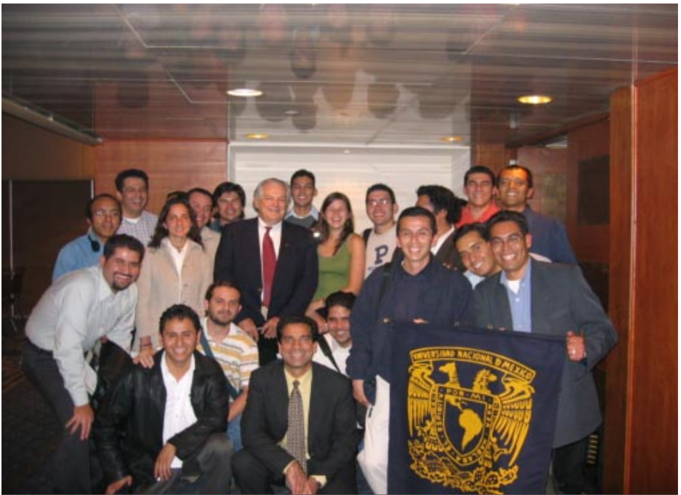
Estudiantes del Posgrado en Ingeniería de la UNAM con Craig Comartin

Las pruebas cristalográficas y mecánicas del material, correspondientes a sus fases martensítica y austenítica, permitieron tener una idea global sobre el uso potencial de esta aleación como parte de un disipador de energía con capacidad de recentreo. Las pruebas mecánicas de las barras se realizaron en la máquina Instron del Instituto de Investigación en Materiales.