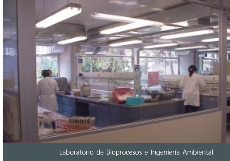
Laboratorio de Bioprocesos e Ingeniería Ambiental

Lo anterior resultará en condiciones para un trabajo ambientalmente seguro en todos los laboratorios, eliminando los impactos ambientales negativos que hasta ahora se han causado, y avanzar hacia el manejo adecuado de productos y residuos peligrosos, en apego a la normatividad vigente. Es además una acción que se enmarca dentro del sistema de calidad que se está desarrollando para el laboratorio.