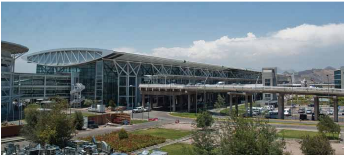
Aeropuerto de Santiago de Chile

También, las misiones técnicas permitieron conocer parques empresariales y almace-