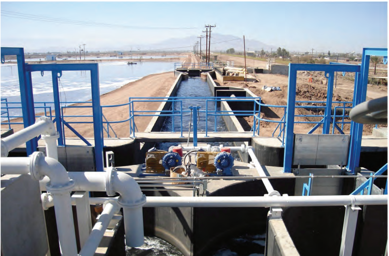
Canal de llegada a la planta de tratamiento de aguas residuales, en Mexicali, Baja California