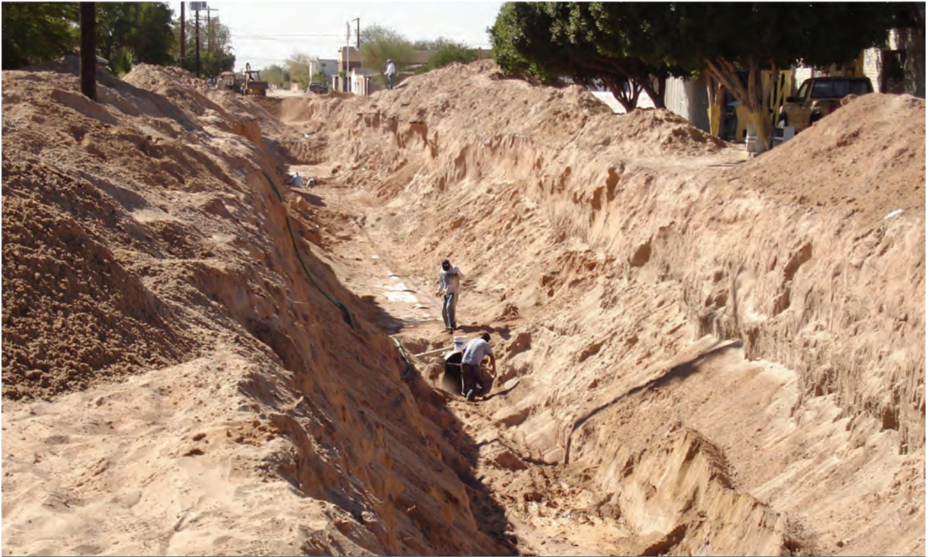
Colector en San Luis Río Colorado, Sonora