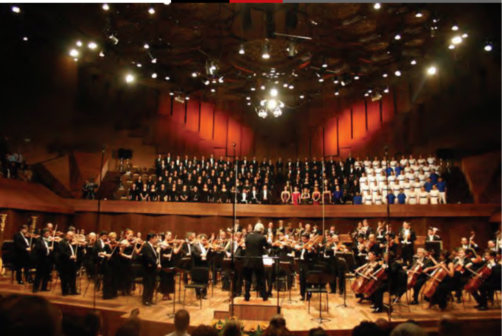
Concierto de gala con motivo del 50 Aniversario del IIUNAM en la Sala Nezahualcoyotl del Centro Cultural Universitario