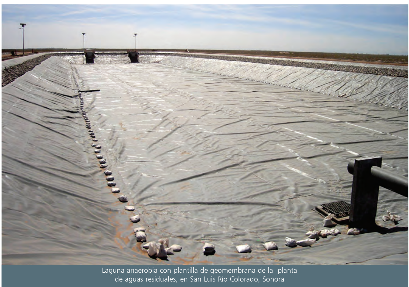
Laguna anaerobia con plantilla de geomembrana de la planta de aguas residuales, en San Luis Río Colorado, Sonora

ciados con el paso de una situación a la otra. Estos costos y beneficios son a su vez de dos clases: los directos, es decir, los que perciben los habitantes beneficiarios de las obras o el medio ambiente que se intenta proteger con dichas obras (suelos o agua), y los indirectos o sociales, que son los que la sociedad en su conjunto recibe o paga, eliminando las transferencias de beneficios y costos de un sector a otro de la sociedad.