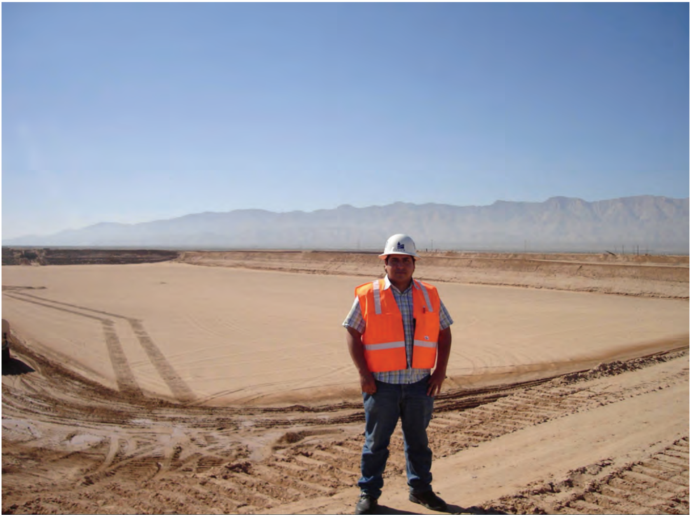
Laguna de aireación en la planta de tratamiento de aguas residuales Mexicali 2