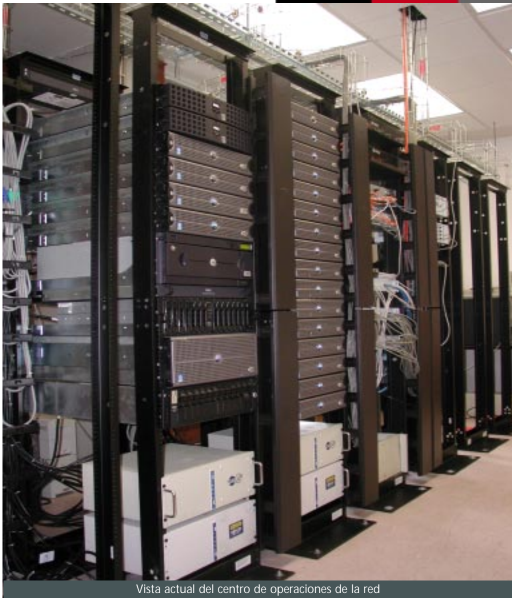
Vista actual del centro de operaciones de la red