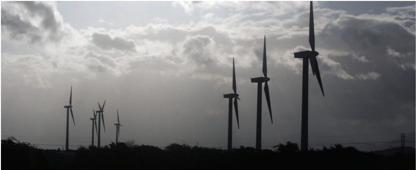
Parque Eólico en Juchitán de Zaragoza, Oaxaca

La aplicación de la ingeniería es muy interesante. En mi familia soy el primer ingeniero, después una de mis hermanas estudió Ingeniería Metalúrgica y otro más es ingeniero civil.