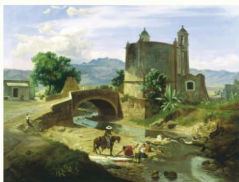
Puente de Chimalistac, el Puente de San Antonio en el Camino de San Ángel 2

Creo que la ciencia tiene una gran belleza. Un científico en su laboratorio no es sólo un técnico: es también un niño colocado ante fenómenos naturales que le impresionan como un cuento de hadas. Marie Curie 1